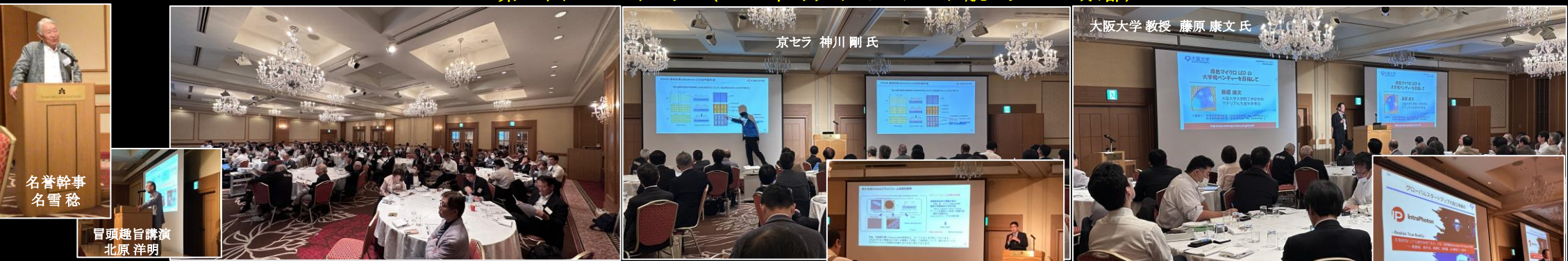
名誉幹事 名雪 稔