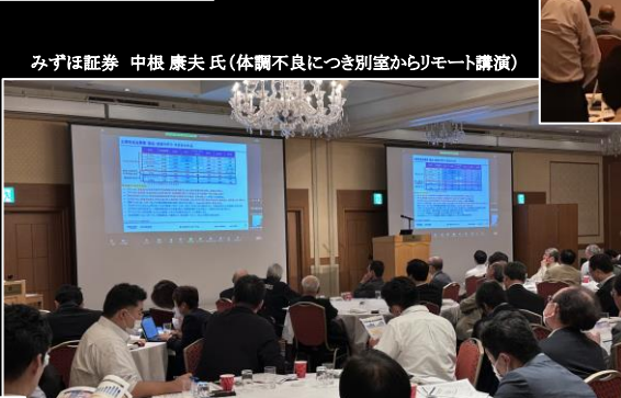
みずほ証券 中根 康夫氏(体調不良につき別室からリモート講演)